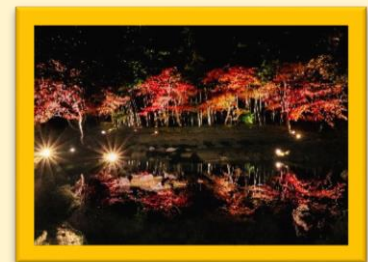
H29 最優秀賞 「晩秋に映える」