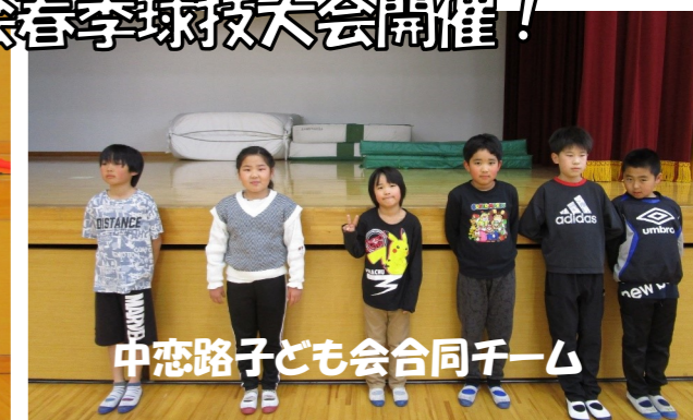
中恋路子ども会合同チーム

4子ども会・4チームが参加し、ドッジボールを行いました。 みんな楽しく、自然した試合に盛り上がりました。