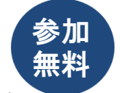
家庭教育応援サイト 子育てマナビ