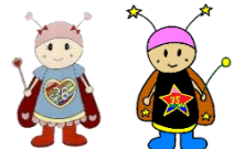
宮野ホタルまつり協賛会

【開催日】令和5年6月10日(土) 16時～20時30分 ※雨天の場合は、6月11日(日)に延期。 【会場】宮野地域交流センター駐車場および館内 ※センターの館内は飲食禁止 【内容】ステージ発表・地域団体による出店・児童によるホタルの絵・作文展示、ゲーム他 ◆『開催プログラム』は、市報6月1日号配布時に全戸配布します◆