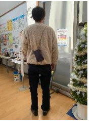
※サンプルが窓口にあります