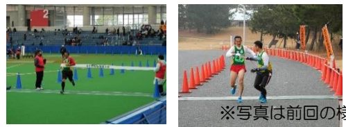
※写真は前回の様子です

【日 時】1月15日(日) 10時～(体協の部・一般1部) 【場 所】山口きらら博記念公園特設コース