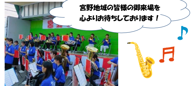
宮野地域の皆様の御来場を心よりお待ちしております!