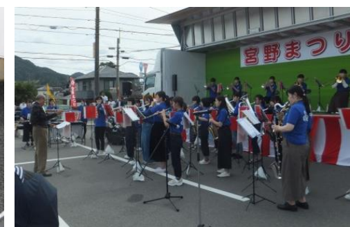
※写真は「宮野まつり2019」の様子です。