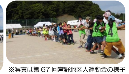
※写真は第67回宮野地区大運動会の様子