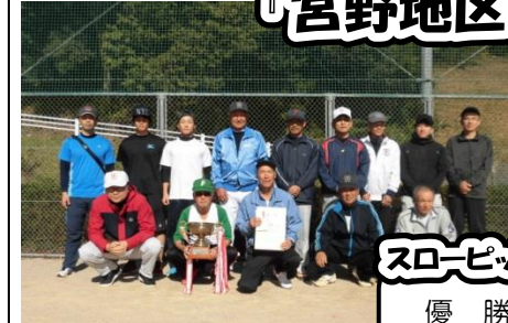
スローピッチソフトボール