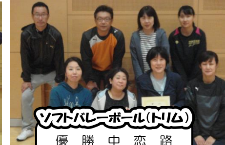
ソフトボール(トリス)