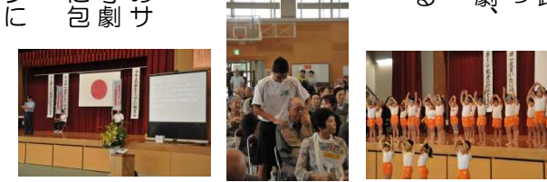
主催者 宮野地区社会福祉協議会

平成二十七年宮野地区敬老会が、九月十二日(土)宮野中学校体育館において、対象となる方、二百二十五人をお迎えして、総勢四百八十余名(出演者・スタッフ含め)の方々に参加、ご協力いただき盛大に開催いたしました。※現在、宮野地区には百歳以上の方が九人(男二人、女七人)、敬老会の参加対象となる方(数え年七十五歳以上)は、二千三十六人いらっしゃいます。 敬老会は、午前十時から主催者挨拶につづき、米寿の方に記念品をお贈りし、来賓の祝辞・紹介、祝電披露、参加代表による謝辞、小学生による敬老ポスター作品展の入選者の紹介などの式典を行い、続く余興では、宮野幼稚園園児による歌と踊り、宮野小学校児童による「輝け宮野っ子」(六組二十二人によるダンスや寸劇、ピアノ連弾などを披露いただきました。 宮野中学校生徒有志のみなさんによる「寸劇」・「笑点」・「肩こみ」・「肩たたき」が行われ、日頃の疲れやコリを少しほぐしていただきました。その後、お弁当をお配りし、昼食後は、宮野中学校吹奏楽部による思い出の曲のメドレーなどの演奏や唱歌、「青い山脈」の歌の披露では、参加者と一緒に口ずさんでいらっしゃいました。最後に、山口署生活安全課の方による振り込め詐欺など「110電話詐欺」を防ぐための寸劇と説明があり、終始、和やかな雰囲気になりました。午後一時に閉会となりました。 今年は、手話通訳だけでなくパソコンによる「要約筆記」での情報提供を行いました。また、防長バス路線がない地区に小型バスやコミタクを臨時運行しました。そして、今年も宮野中学校の生徒さんに会場のシートはり、駐車場つくりや後片付けをしていただきました。準備、運営には、民生委員さんや福祉員さんなど多くの方々の協力により、開催することができました。心より感謝申し上げます。