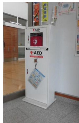
宮野地域交流センターでは、正面玄関を入って右側にAEDを設置しています。

「かけこみ119番の家」とは、火災や交通事故、急病等の緊急事案発生時に、助けを求めてこられた方に対して、救命率の向上や火災被害軽減の基本となる「早い通報」「早い応急手当」「早い初期消火」の協力をしていただける事業所です。この制度は、地域貢献や共助の精神によるボランティア活動で、登録された「かけこみ119番の家」には目印となる「のぼり旗」や「応急手当セット」が配備されています。また、施設によっては、設置されたAEDや消火器を活用し、対応することとしています。 平成29年12月からは、市内全ての総合支所、地域交流センター及び分館もこの取り組みを開始しました。