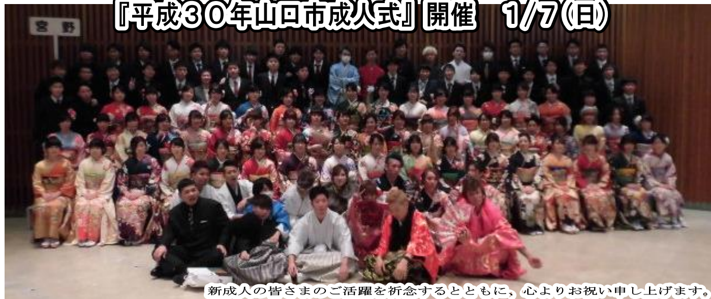
新成人の皆さまのご活躍を祈念するとともに、心よりお祝い申し上げます。

山口市成人式にて撮影しました記念写真ができました。当日の撮影に参加された方は、記念写真をお渡ししますので、下記のとおり宮野地域交流センター事務室までお越しください。※ご家族・代理の方でも結構です。 【期間】2月1日(木)～3月30日(金) 平日の8時30分～17時15分 【料金】無料(宮野財産区からの寄贈) 【場所】宮野地域交流センター(TEL 928-0250)