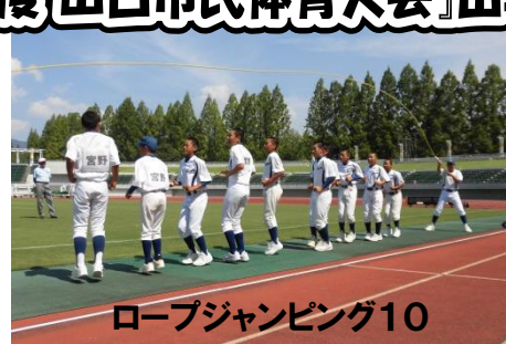
ロープジャンピング10