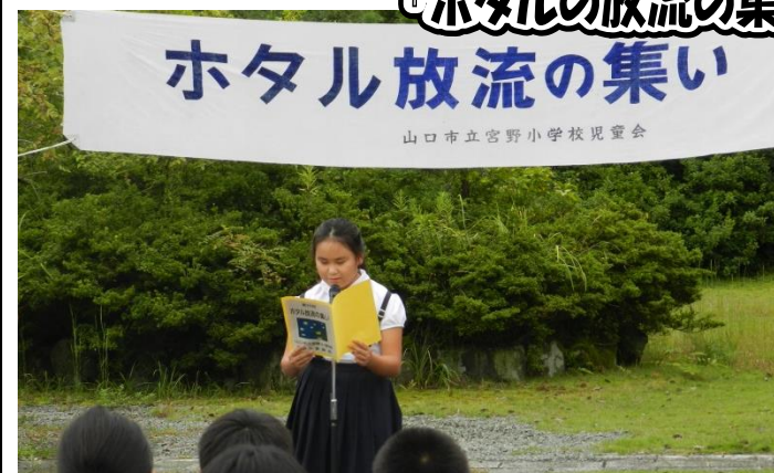
ホタル放流の集い