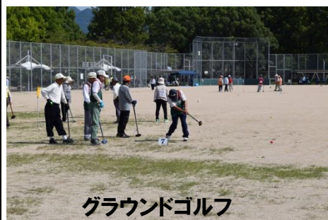
グラウンドゴルフ