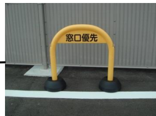
黄色のスタンドを置いてます

窓口に来られる方の優先区画を作りました。身障者用駐車場及びスプレー缶等回収ボックスの場所の確認も今一度お願いします。なお、自動車での駐車場の通り抜けやセンター裏の通行は、大変危険なのでしないでください。皆様のご協力をお願いします。