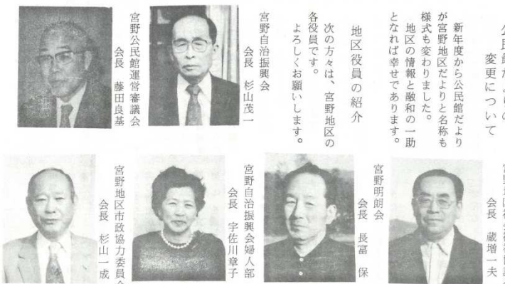
※「地区だより“みやの”第1号」から抜粋

昭和62年4月1日 第1号 山口市宮野下3054(住吉) ☎ 28-0250 宮野公民館 発行 宮野公民館活動推進委員会 面積 39,89㎢ 世帯数 4,455 人口 13,018(男 6,054 女 6,964)